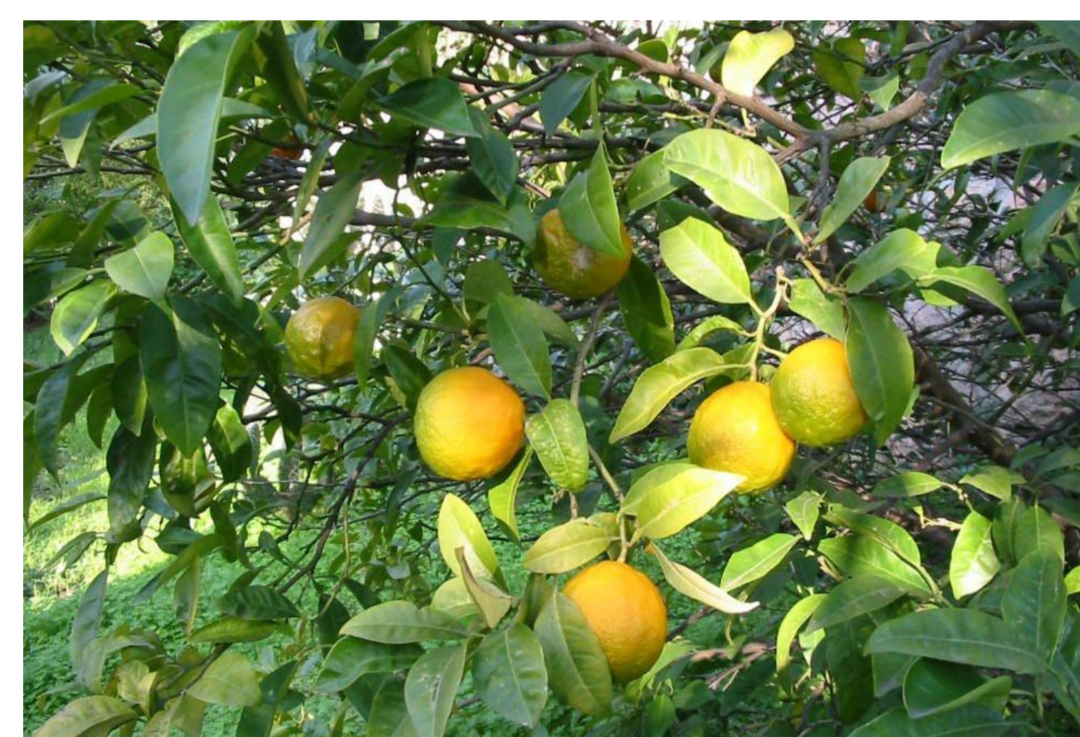
Règne: Plantae Division: Magnoliophyta Classe: Magnoliopsida Ordre: Térébenthales Famille: Rutaceae Genre: Citrus